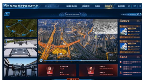
实时监控与指挥调度