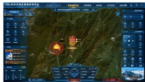
实时任务管理与部署