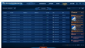
数据分析处理与建模