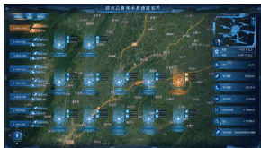
远程部署与集群控制