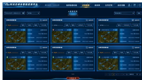
多维空域及航线管理