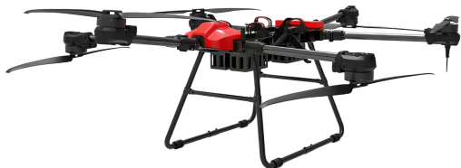
TIM-YT100 | 光伏电站专用清洗