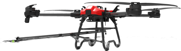
TIM-YT50 | 楼宇幕墙清洗旗舰